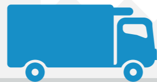
EV-580 e EV-580S Até 26 m 3