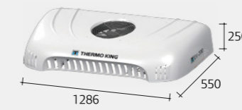
Condensador EV-200*/EV-300* (Teto/Bico)