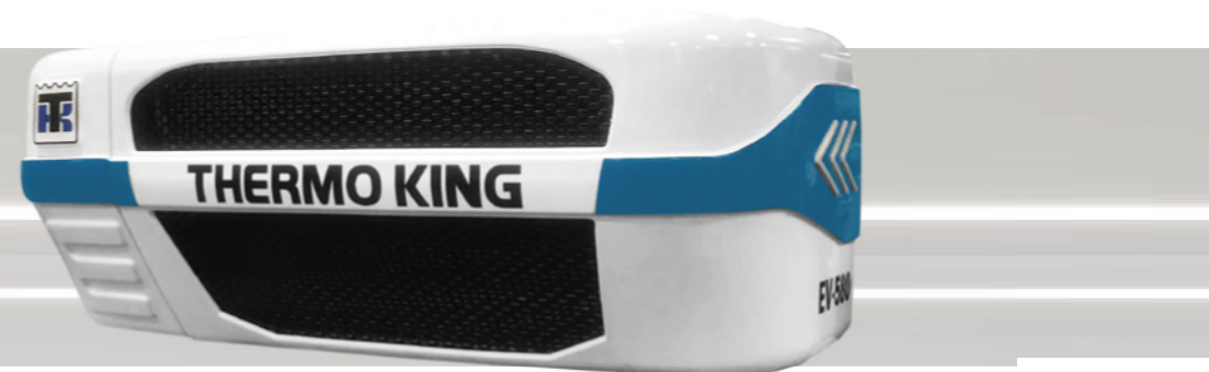
EV-580 &amp; EV580S