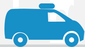
EV-200* e EV-300* Até 16 m 3

Consulte um distribuidor autorizado Thermo King sobre as opções disponíveis em sua região*