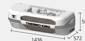
Condensador EV-580/ EV-580S