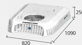
Condensador EV-200* (Teto)