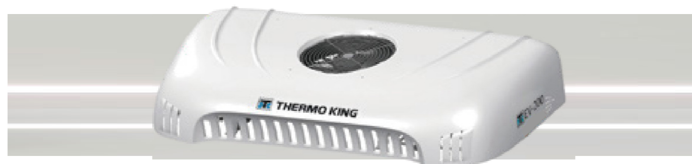
EV-200 &amp; EV-300

Consulte um distribuidor autorizado Thermo King sobre as opções disponíveis em sua região*