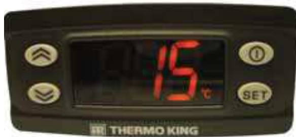
Mando de control en cabina

El sistema de control electrónico está formado por un módulo de control electrónico (ubicado en el interior del condensador) y el mando de control en cabina. Este mando de control en cabina permite al conductor del camión utilizar la unidad de refrigeración de Thermo King.